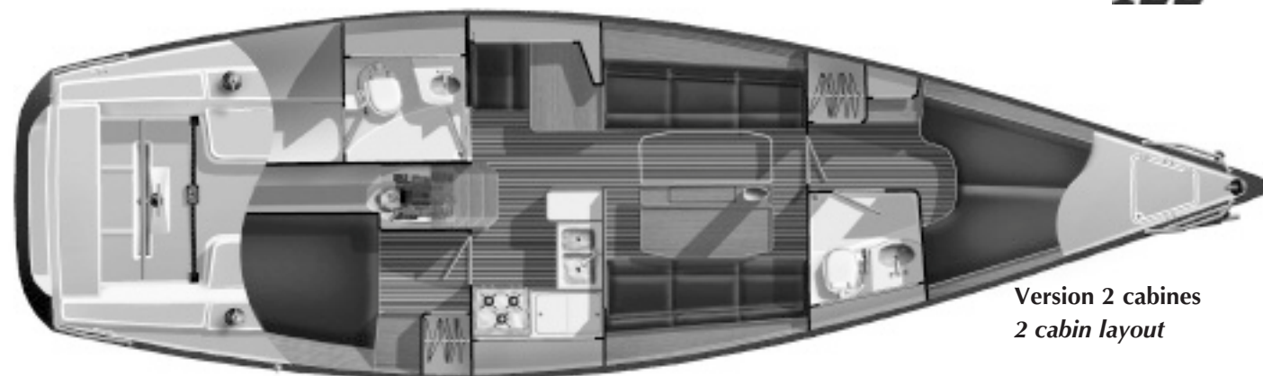
Version 2 cabines 2 cabin layout