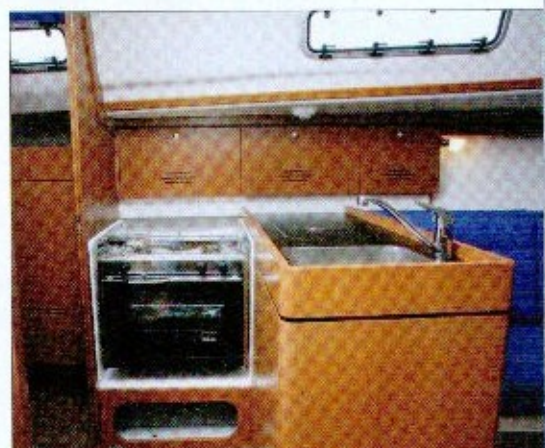
▲ En L, la cuisine offre une bonne capacité de rangement avec un grand placard sous l'évier.

8. Le cockpit est ouvert sur l'arrière avec, au niveau du tableau, un banc transversal. Il mesure 2,50 m de long et 0,80 m de banc à banc. Les deux coffres, dont un pour le gaz, sont intégrés au banc côté tribord.