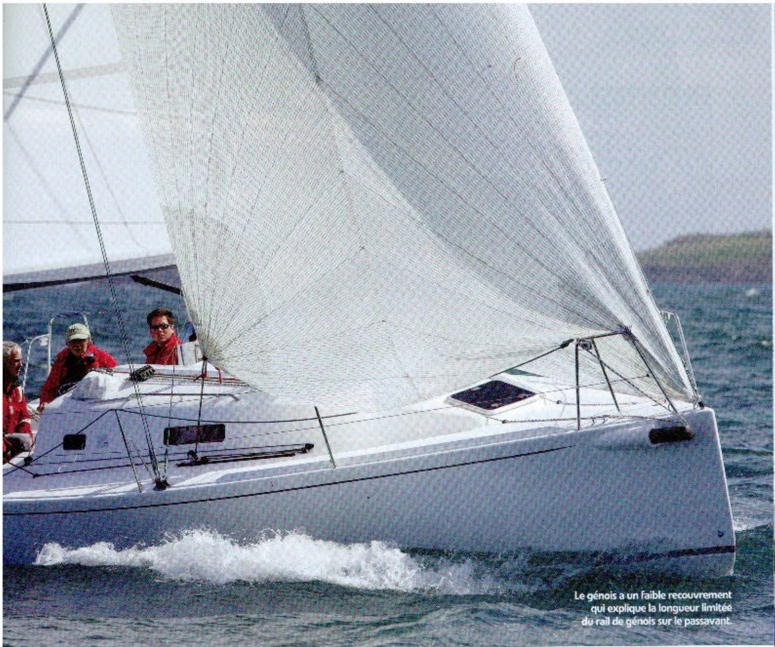
Le génois a un faible recouvrement qui explique la longueur limitée du rail de génois sur le passavant.