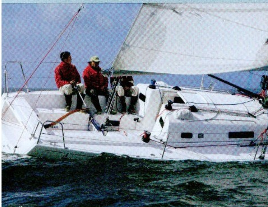
Pratique Dans le cockpit ouvert sur l'arrière – une première pour J – on tient facilement à quatre. Assis sur le plat-bord, il est facile de se caler les pieds sur l'angle du banc qui remonte.