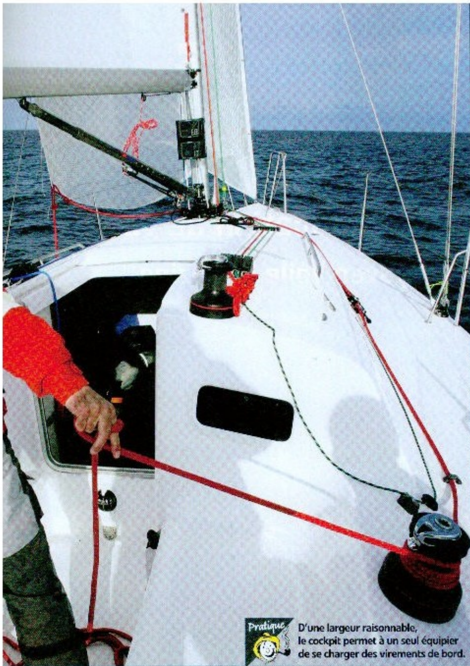
Pratique D'une largeur raisonnable, le cockpit permet à un seul équipier de se charger des virements de bord.