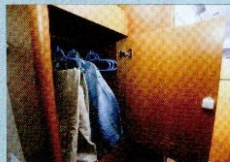
Pas pratique Il n'est pas vraiment utile de disposer d'une aussi grande penderie dans la cabine arrière.