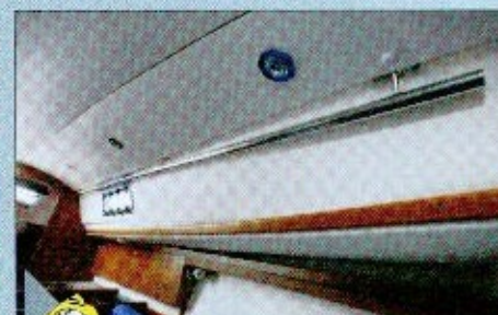
Pas pratique On aurait souhaité que la main courante en inox soit plus basse.